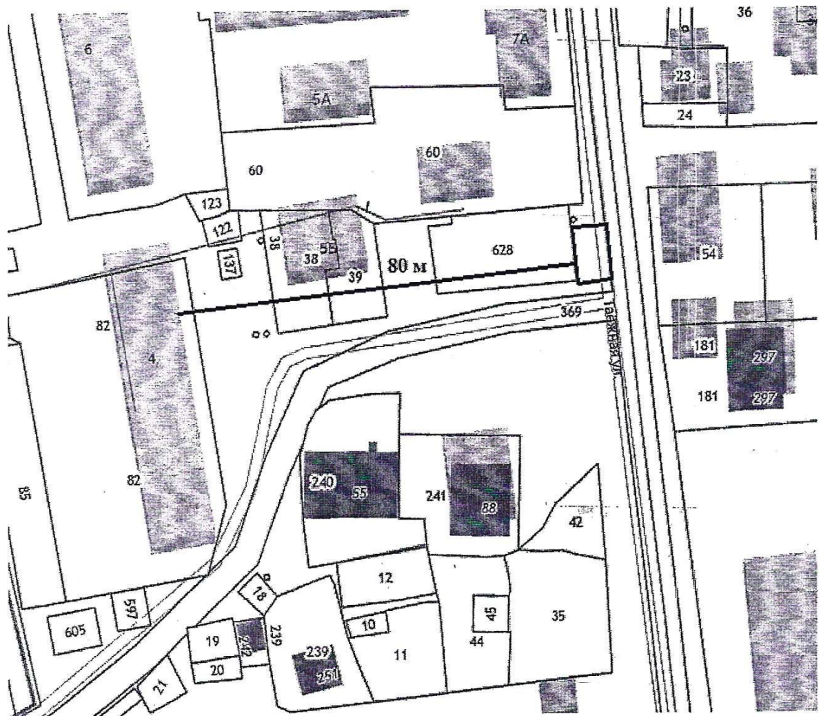
Масштаб 1: 1000

Группа реализуемых товаров – продовольственные товары. Срок размещения – в течении года. Площадь места – 200 кв.м.