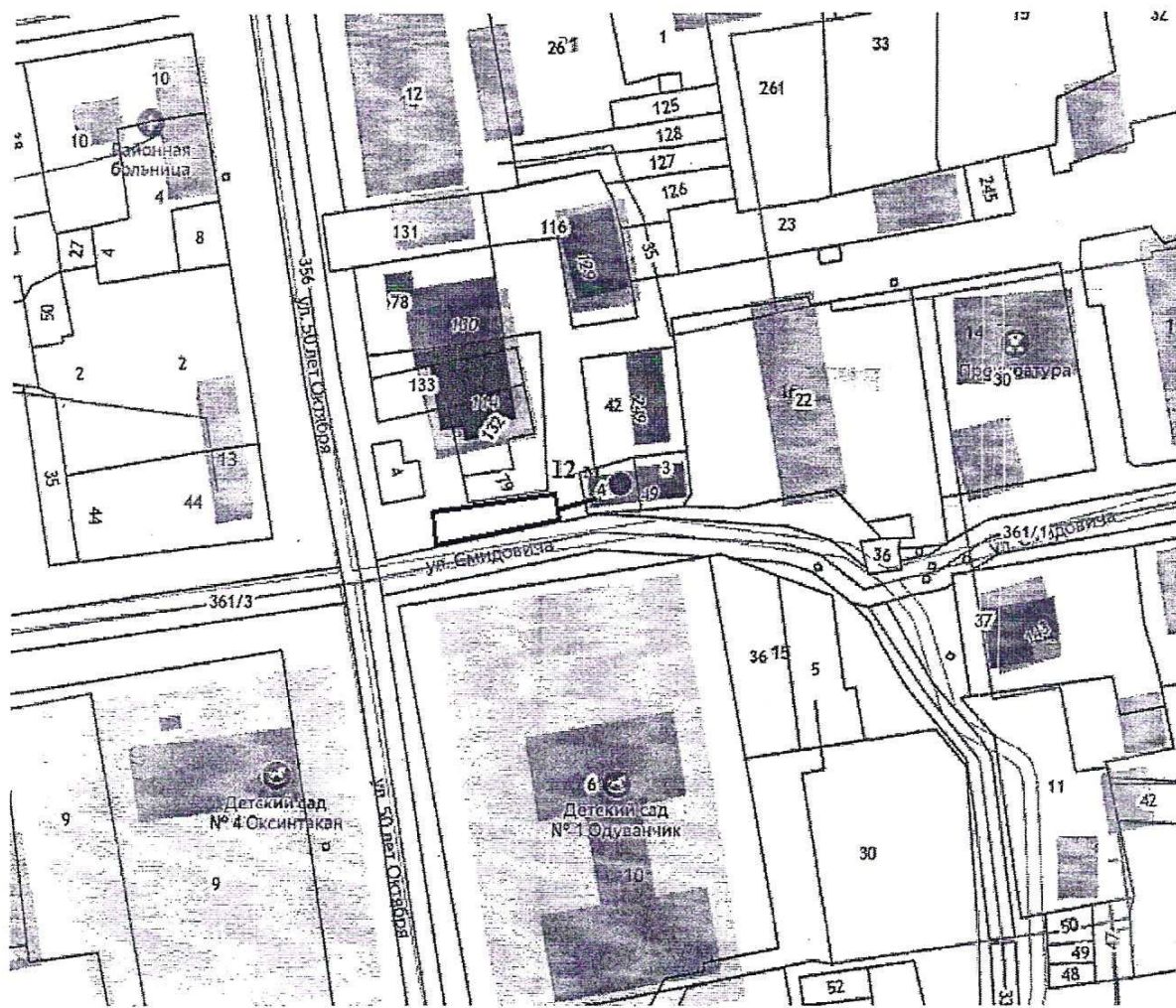
Масштаб 1: 1000

Вид нестационарного торгового объекта – палатка, лотки, автолавка. Группа реализуемых товаров – смешанные товары. Срок размещения – июнь-сентябрь. Площадь места – 80 кв.м.