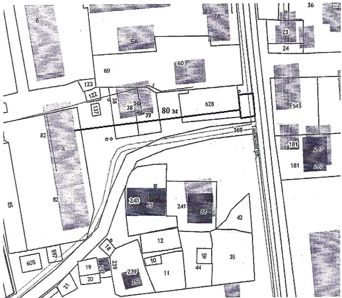
Масштаб 1: 1000

Группа реализуемых товаров – продовольственные товары. Срок размещения – июнь-август. Площадь места – 75 кв.м.